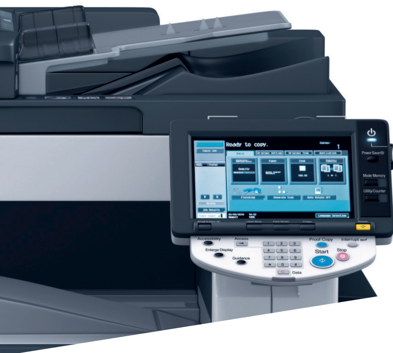
Das leicht bedienbare Farbdisplay der ineo 223

Die hohe Druckqualität in Verbindung mit einer großen Auswahl an Finishing-Funktionen ermöglichen es, selbst höherwertige Dokumente wie Broschüren inhouse zu drucken, zu lochen oder zu heften. Das steigert die Produktivität nachhaltig!