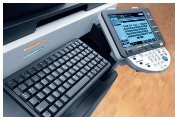
ineo 223 farbiges Touchscreen Display und optionale Tastatur für einfache Eingabe

Profitieren Sie von einem perfekten Team und nutzen Sie die ineo 223 für die Dokumentenproduktion in Schwarzweiß kombiniert mit den ineo+ Systemen für die Erstellung professioneller Farbdokumente.