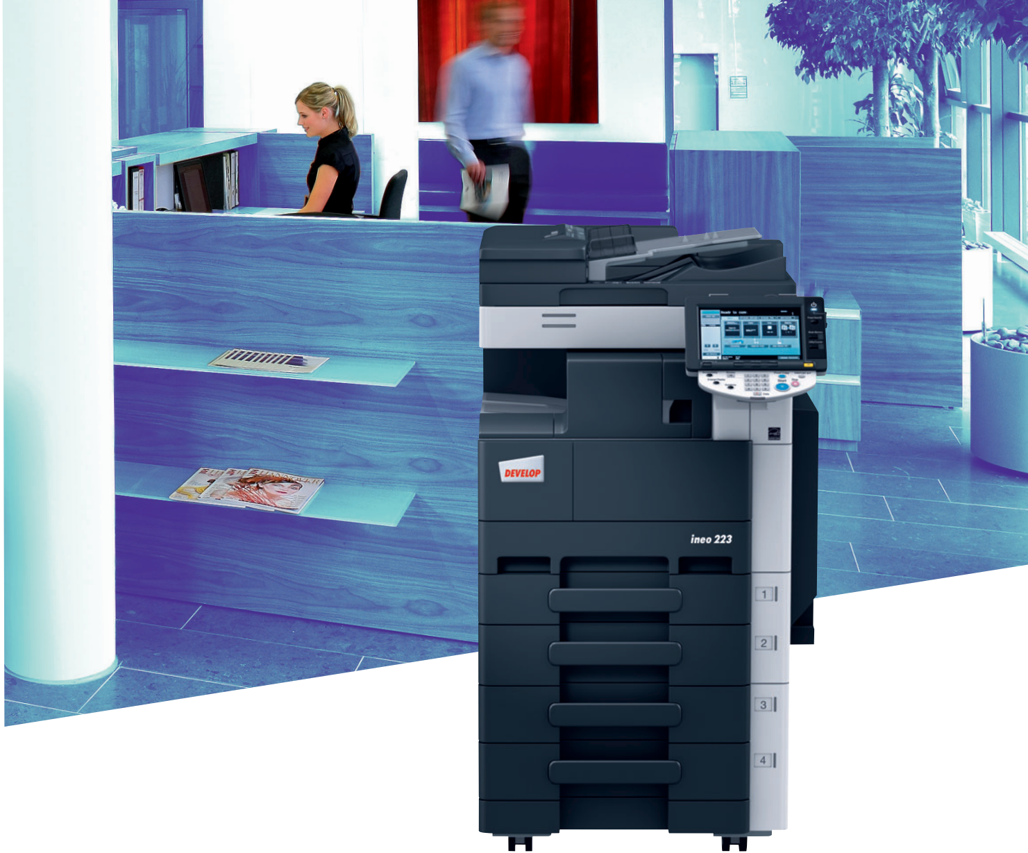
ineo 223 mit integriertem Heft-Finisher (FS-529), Papierkassette (PC-208) und Originaleinzug (DF-621)